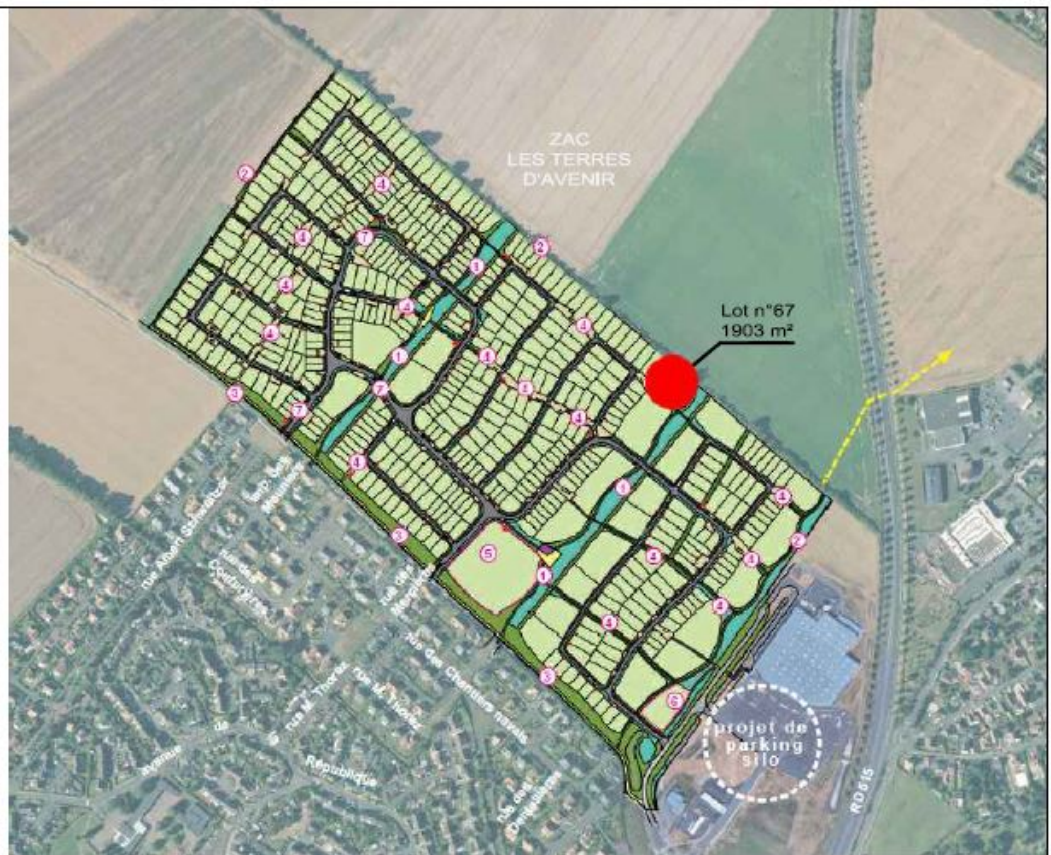
SITUATION DANS LA ZAC - Sans échelle

forma* VISA PC • 17 rue de la Haute-Basse-Fer 44037 | 44201 NANTES Cedex 2 • T: 02 40 28 47 25 - forma@forma.fr • SIRET 502381870051 - APE 7112Z • N° Ordre des Architectes 19 081 5.002228